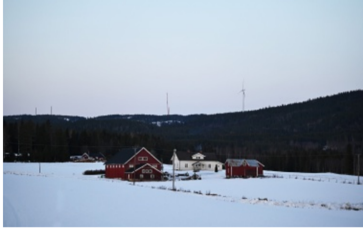
VINDMØLLER I SKOGBYGDGA: Flere av vindmøllene i Nord-Odal er godt synlige langs Sjølivegen i Skogbygda.