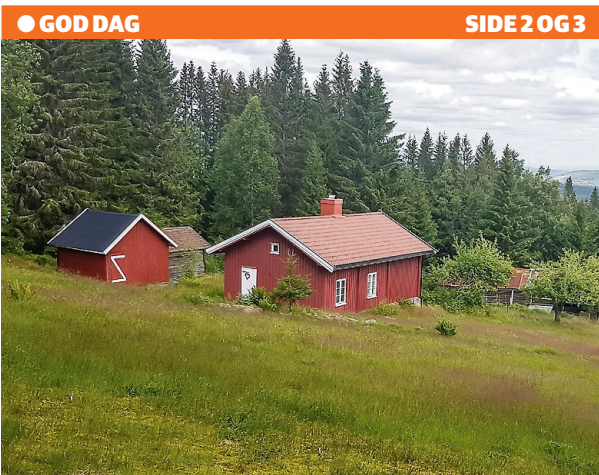
Plass med historie i veggene