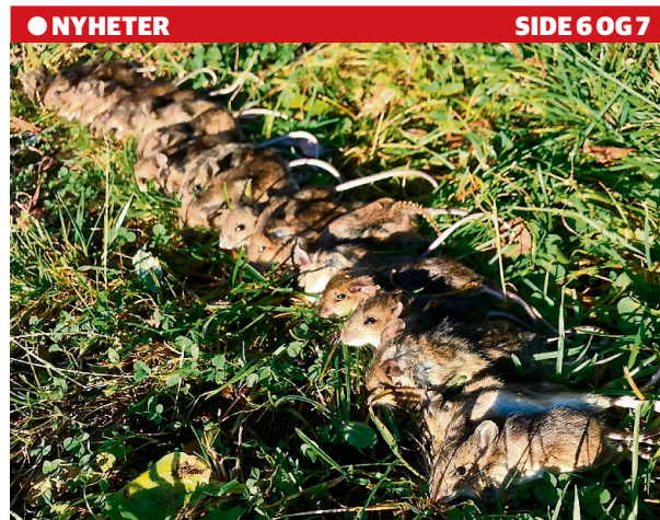
Nå er denne gjengen på vei