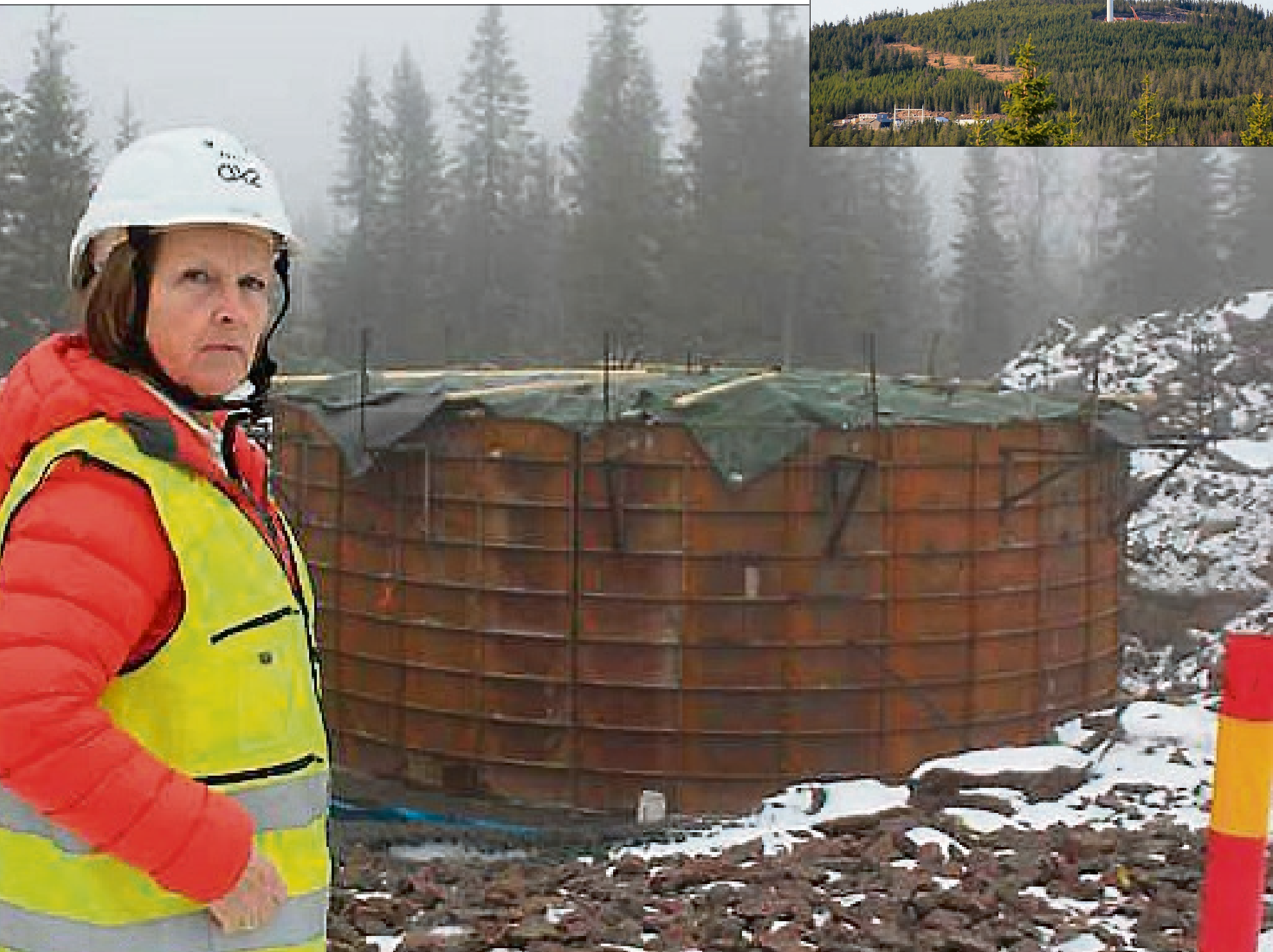
mener at utbyggingen og driften av vindkraftverket i Kjølberget er ulovlig, og at dette må få konsekvenser. Det står nå 13 vindturbiner klare (innfelt) og produksjonen av strøm går for fullt.