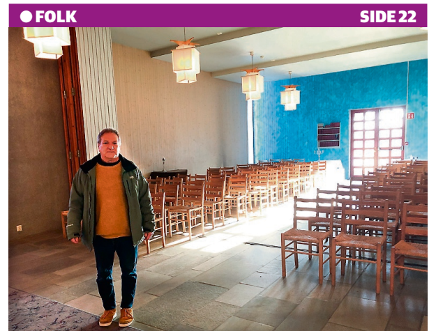
Vil ha mer bruk og nytt navn