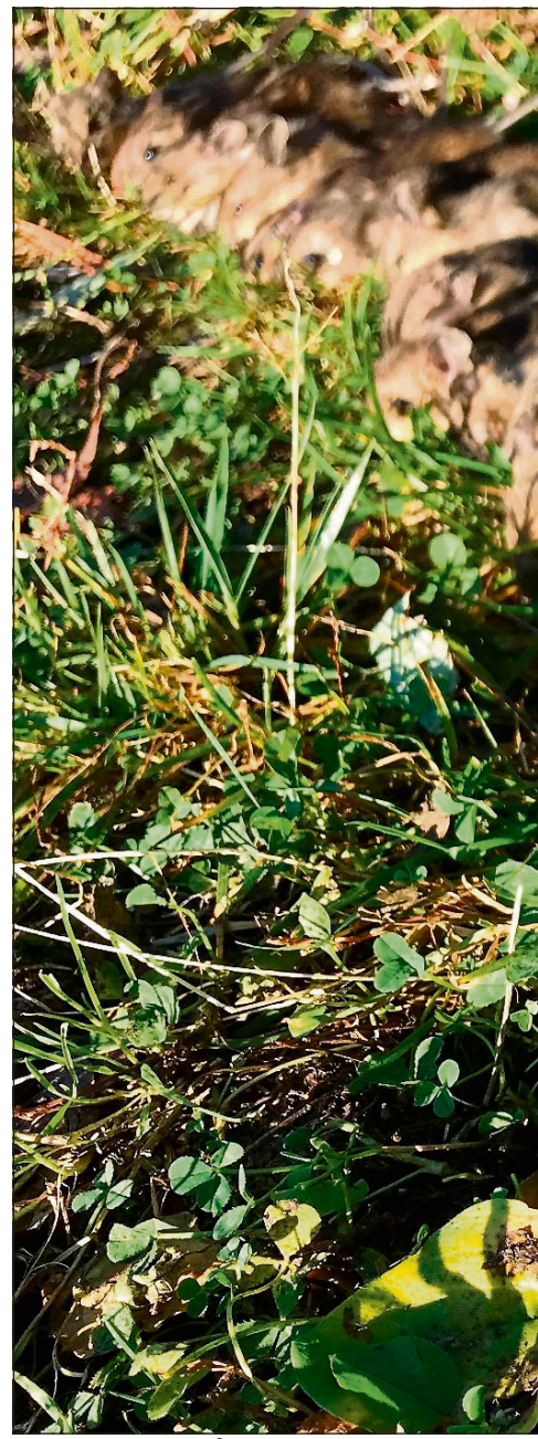
FÆRRE MUS I ÅR: - Det er langt færre mus fjor høst.

Både klatremus og skogmus trekker inn i hus i høst. Mark-