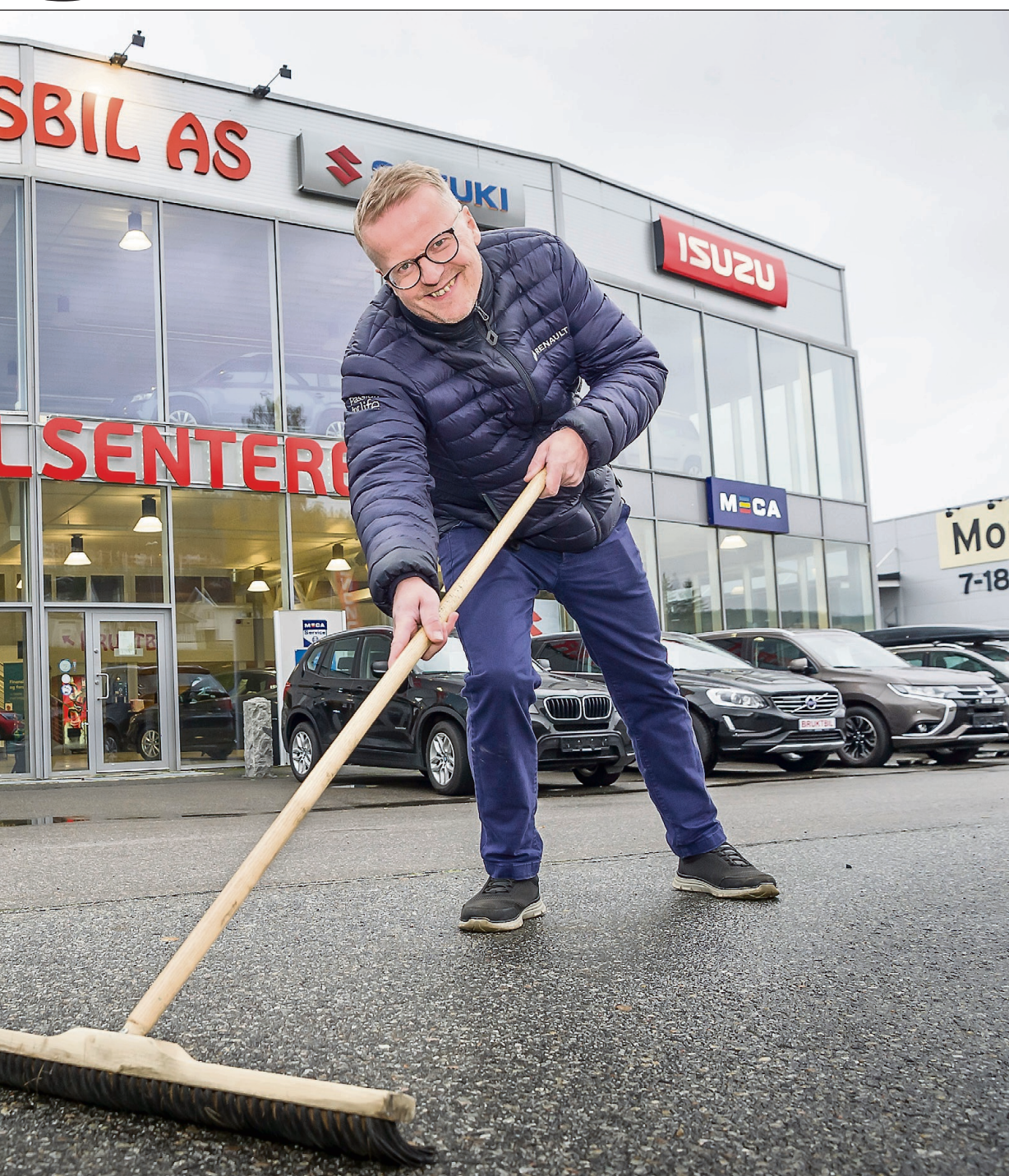
fra et underskuddforetak til å gi millionoverskudd.