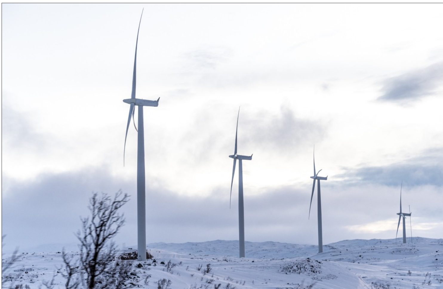
VINDMØLLEPARK: Nordkraft AS jobber med flere prosjekter innen Gielas reinbeitedistrikt. Men de holder kortene inntil brystet om hvor det kan komme. Bildet er fra vindmølleparken på Nygårdsfjell i Narvik kommune.

– Generelt er ikke prosjektene vi jobber med åpent for innsyn i tidlige stadier. Vi leverer ikke ut denne type informasjon. Det kan være mange årsaker til det, for eksempel en konkurransesituasjon eller at det er så tidlig at det ikke er relevant, sier han.