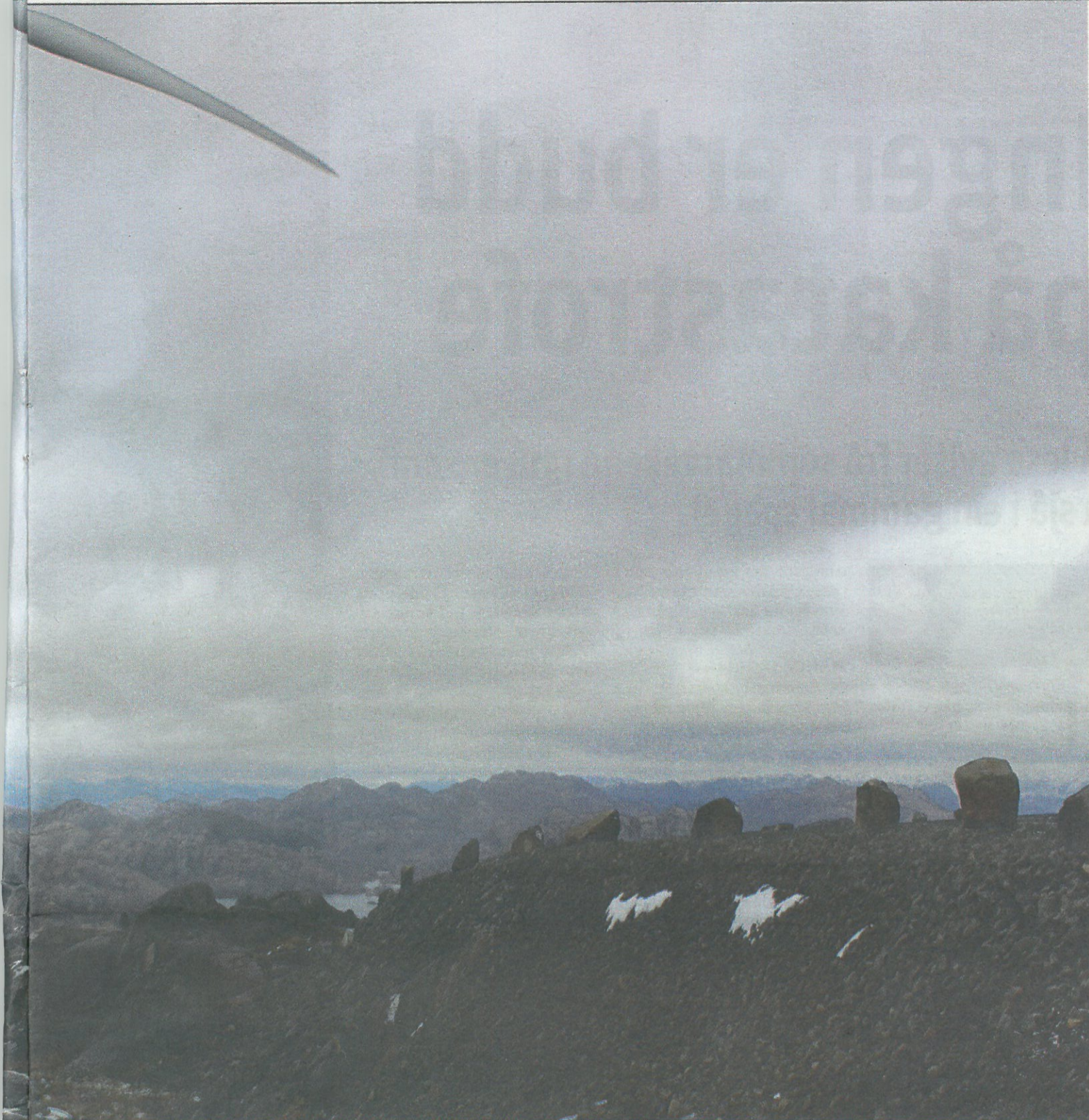
betongfundamenta dei står på, men kilometervis med internvegar og store fyllingar, som her frå Egersund vindkraftverk.