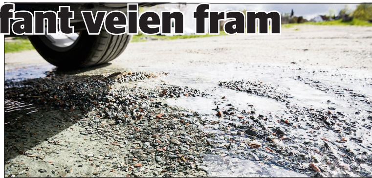
LEKKASJE: Klart vann pipler opp av bakken på den gamle hustomta ved krysset Sofies gate og Engens gate.