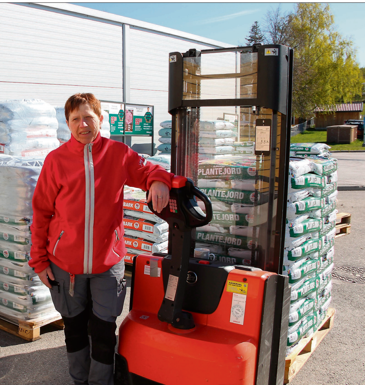
bra for Nord-Odal.