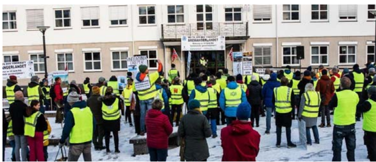
BILDESERIE 18 BILDER

– Han stod der i ein time og hørde på velbegrunna appellar frå folk frå heile fylket. Han kom opp på podiet til slutt med eit ferdigskrive manus med seg, så han svarte ikkje på noko av det vi hadde teke opp i våre appellar, verken bulyst eller fugleproblematikk. Det var ikkje interesse for å høyre på våre argument i det heile, seier Nesbakk.