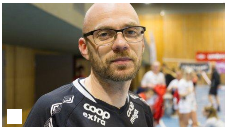
Frustrert etter tap. - Vi hadde alt for mykje respekt for Flint