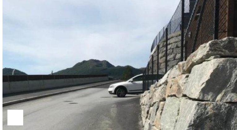
Meiner ny veg er farleg: - Vi har ingen barn å miste