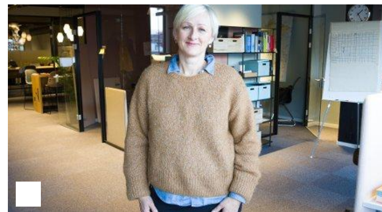
Gründersenteret får nye oppgaver og nytt namn: - Veldig kjekt at vi blir satsa på