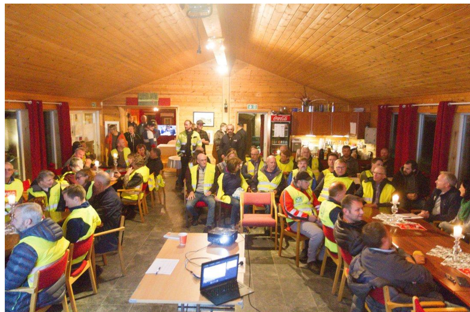
OPPMØTE: Det var fullt i lokalet på Yndestad gard i Guddal.