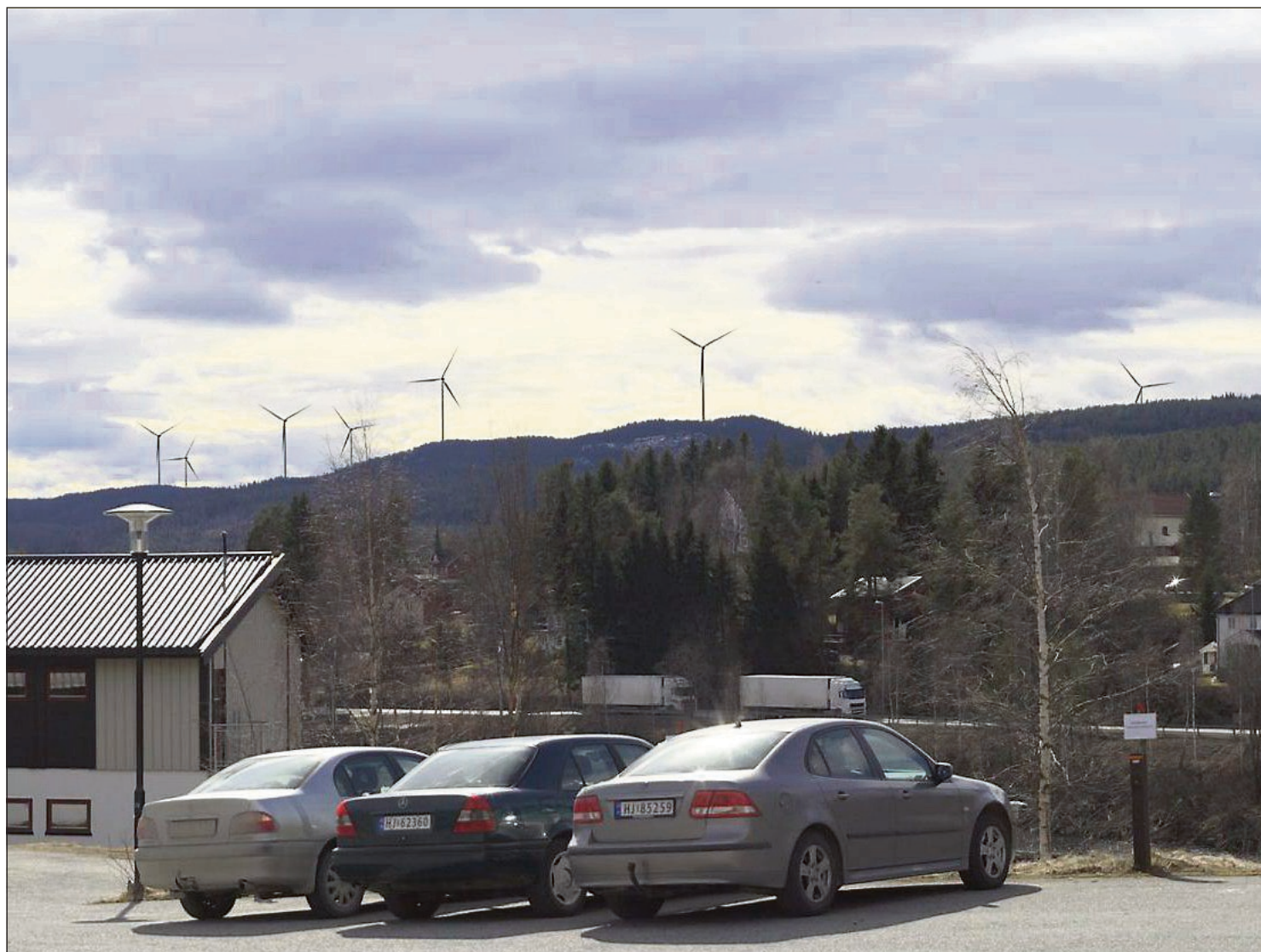
VINDMØLLER: Når kommunestyret i Nord-Odal møtes i dag, får de en klage fra 32 grunneiere og naboer på sitt bord. Slik vil de planlagte vindmøllene bli seende ut fra Sand.