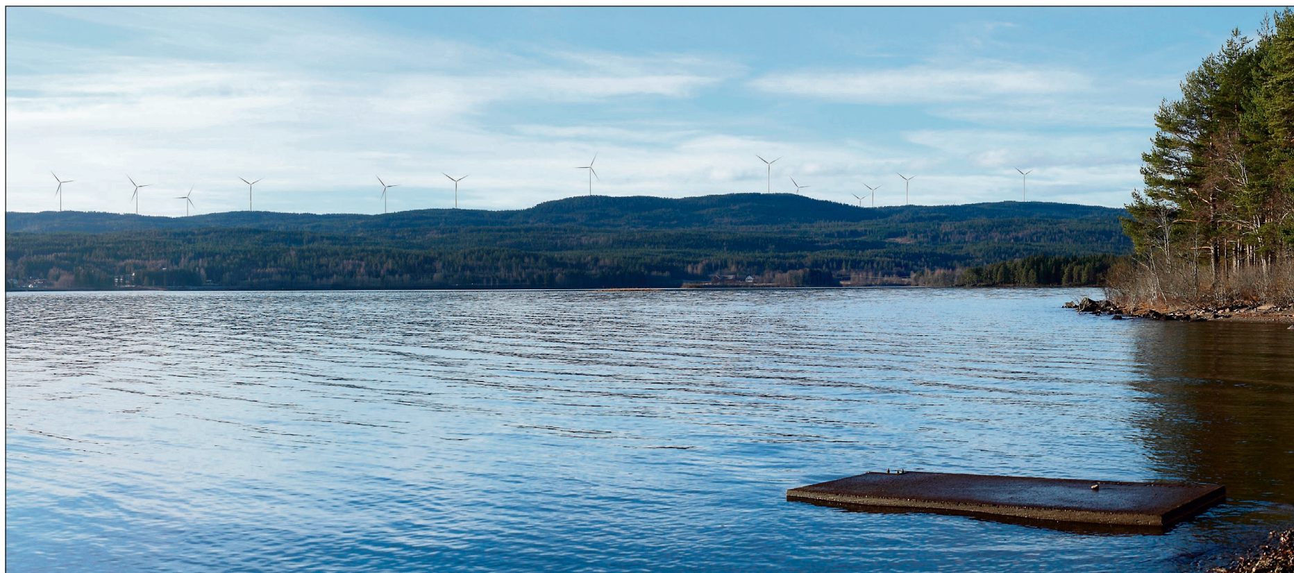
OMSTRIDT: Slik vil vindmøllene på Songkjølen synes fra Bukkeneset.