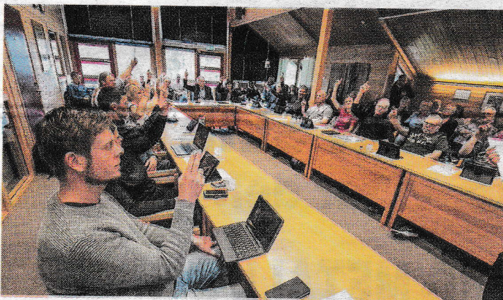
Kommunestyret under avstemningen. Her stemmer de enstemmig ned forslaget fra rådmannen. Flertallet sa helt nei til vindmøller.

Etter det Fædrelandsvennen forstår vil det samme snart skje hva angår Kylland.