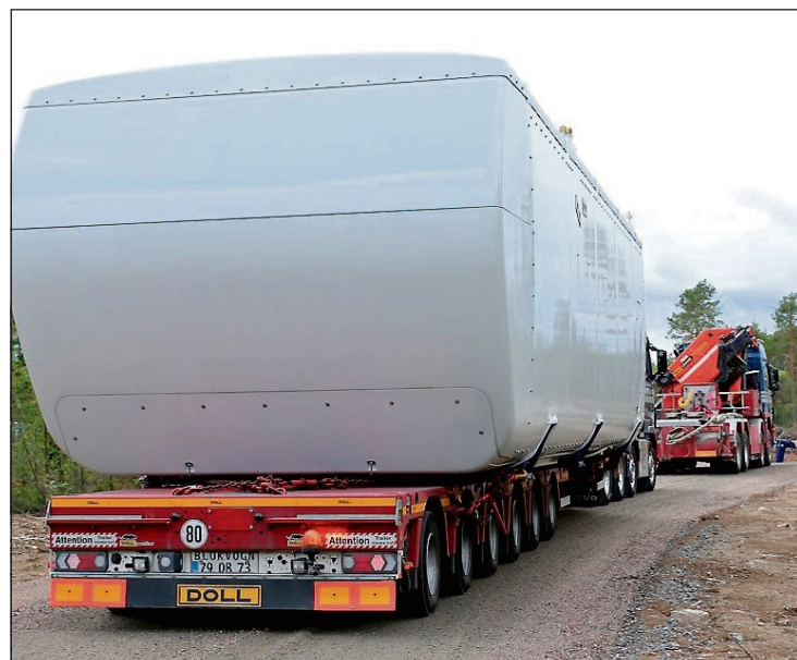
TUNGT: Det blir store, tunge vogntog som skal frakte tårn, bunnseksjoner, vindmølleblader og andre komponenter til Setskog, dersom Setten vindmøllepark blir en realitet.

Det er mulig å søke Statens vegvesen om dispensasjon fra bestemmelsene om lengde og vekt.