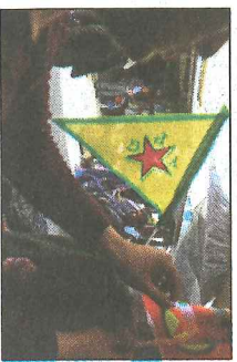
NEDTONA FLAGG: Kurdarane i Syria er klare for samarbeid.

Klassekampen honorerer normalt ikke innsendt stoff. Innsenderens e-postadresse blir trykt med mindre innsenderen reserverer seg mot dette.