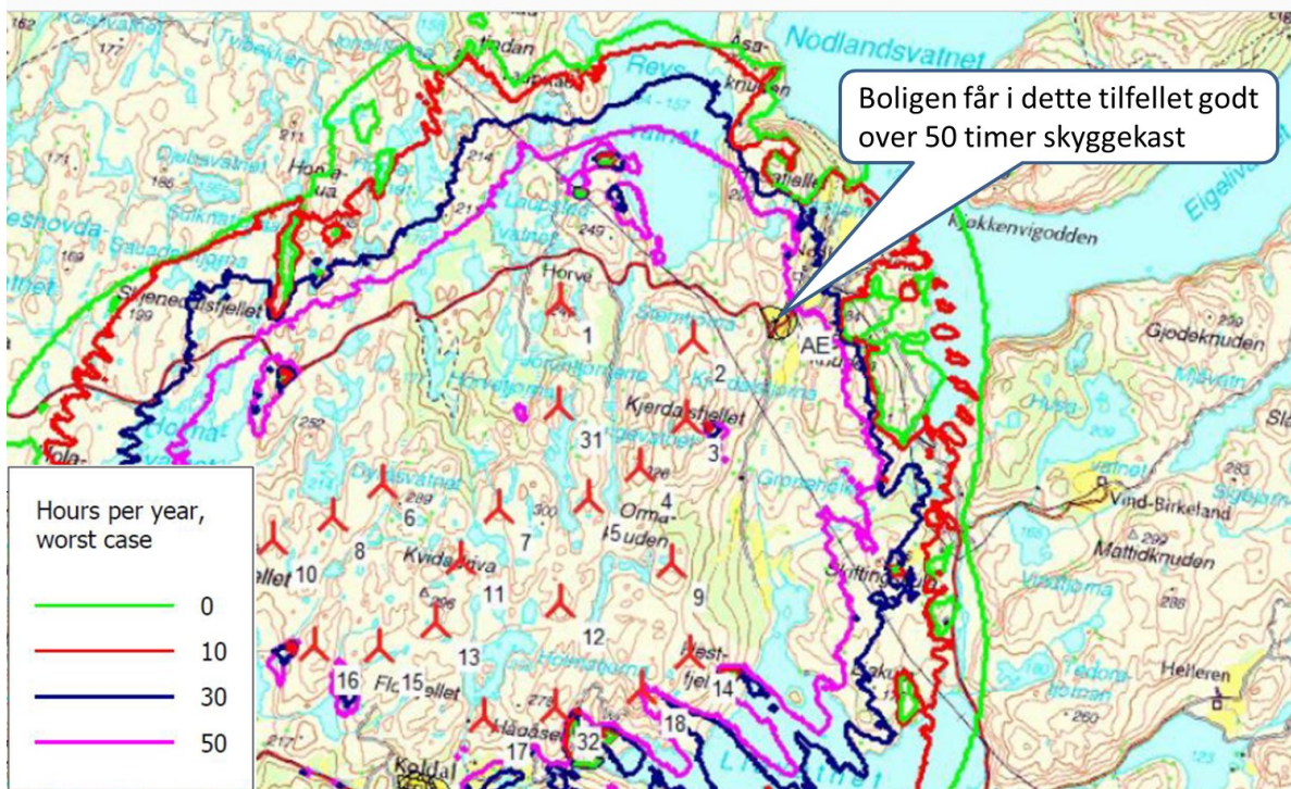
Vedlegg 2: Utbredelse av teoretisk skyggekast