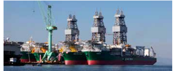
I Norge opplever vi nå stigende arbeidsledighet, spesielt innenfor oljebasert industri. På bildet: Tre Ocean Rig-boreskip med grønt boreutstyr levert av NOV på Dvergnesnes.